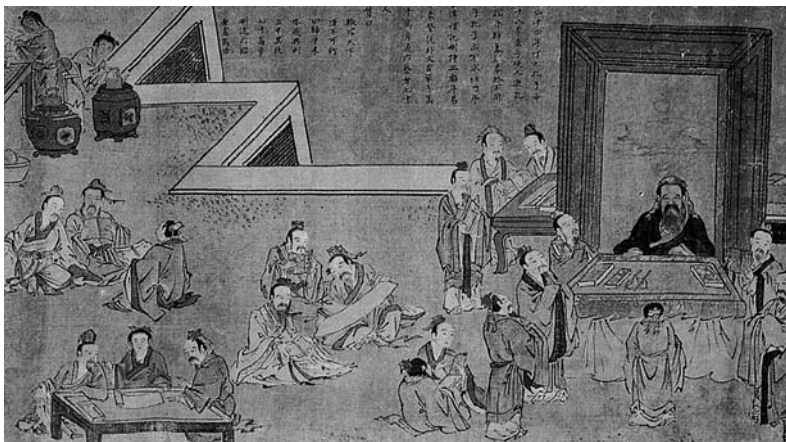
▲亡命の生活の後に魯国にもどった孔子は、3000人といわれる弟子の教育と古典の整理に専念した。

と、もう一度、おなじ質問をくり返している。それに対する孔子の答えは、強烈である。