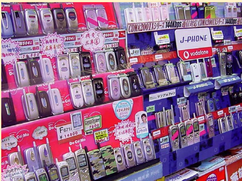
▲プリペイド式携帯電話の裏売買まかり通る ネットや一部の店、身元確認求めず